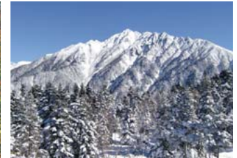
겨울의 니시호타카다케 산(표고 2909미터) 일본 제3위의 표고·호타카 연봉의 서남단 봉우리