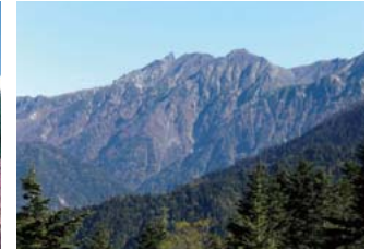
여름의 야리가타케 산(표고 3180미터) 날카롭게 솟아 있는 일본의 마티호른