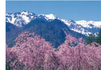
봄의 가사가타케 산(표고 2898미터) 기후현 내의 최고봉이며 히다지역의 명산